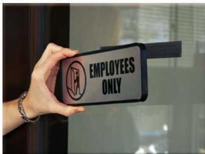
Upevnění plastových značení k okennímu sklu