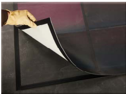
Upevnění flexibilních solárních panelů ke střešní membráně ke zvýšení odolnosti proti větru

E - hnědý polykraftový liner potištěný textem „3M™ Dual Lock™“ v zelené barvě. Vhodné pro diecutting.