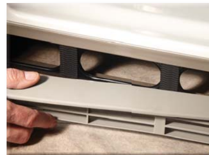
Upevnění plastových vzduchových ventilů k podstavě chladničky k zamezení vibrací